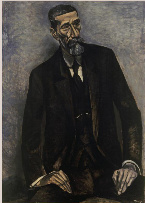
André Derain, Retrato de Iturrino / Portrait of Iturrino , 1914 CENTRE POMPIDOU, PARÍS, MUSÉE NATIONAL D'ART MODERNE / CENTRE DE CRÉATION INDUSTRIELLE