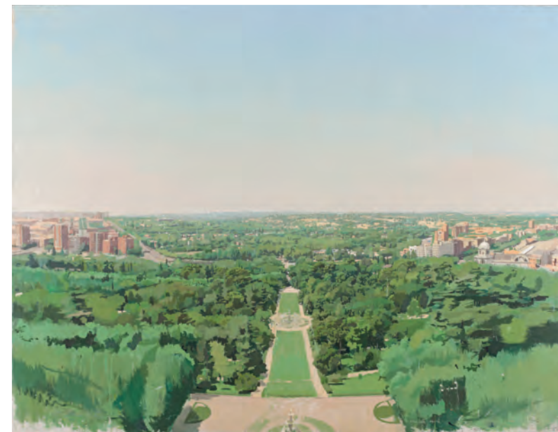
Antonio López, El Campo del Moro , 1990-1994. Óleo sobre lienzo adherido a tabla, 190 x 245 cm. Colección particular

La pintura de figuras es acaso la que tiene un mayor anclaje realista, sobre todo cuando pretende reproducir no solo la apariencia humana sino también su espíritu y su relación con el entorno. Los ejemplos de los siglos XVIII y XIX que abren esta sección juegan con el trampantojo de unos marcos fingidos, que las figuras desbordan como si acabaran de cobrar vida. Son parte de una tradición que, junto con ecos de la escultura clásica o de Velázquez, están en las obras seleccionadas de los realistas del siglo xx. En ellas, los personajes dialogan con el espacio que les rodea, buscando ese ilusionismo de realidad que reposa no sólo en la técnica, sino en su propia condición de seres mundanos, habitantes de un mundo tan real como el del espectador.