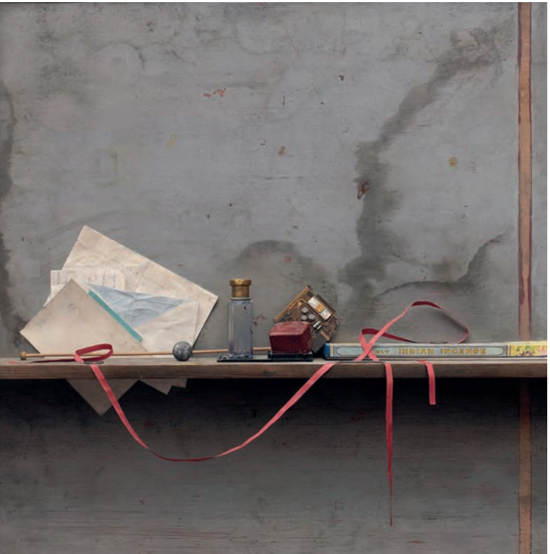
Manuel Franquelo, Sin título , 1991. Acrílico y óleo sobre madera, 80,5 x 80,5 cm. Colección Abelló

Perhaps figure painting has the strongest links with realism, especially when it sets out to reproduce not only a person's appearance but also their spirit and relationship with their environment. The 18th- and 19th-century examples that begin this section play with the illusionism of trompe l'oeil frames from which the figures seem to emerge as if they had come to life. They are part of a tradition that is found in the selected works by 20th-century realists, along with echoes of classical sculpture and Velázquez. The people depicted in them engage with the space around them, seeking the illusion of reality that is conveyed not only by the technique but also by their appearance of flesh-and-blood beings who inhabit a world as real as the spectator's own.