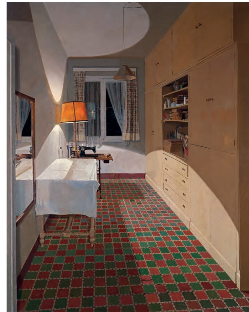
Isabel Quintanilla, Habitación de costura , 1974. Óleo sobre tabla, 100 x 82 cm. Colección de la artista Isabel Quintanilla, Sewing Room , 1974. Oil on panel, 100 x 82 cm. Collection of the artist

Con el realismo del XIX la pintura de vistas urbanas se convirtió en un género de verismo casi documental, gracias a un uso preciso de la perspectiva, la luz, la estructuración de planos y el detalle en la descripción de calles y edificios. Para los realistas españoles contemporáneos será tema recurrente, centrado sobre todo en Madrid y combinando también ciudad y paisaje. Los espacios pintados por estos artistas suelen estar vacíos, pero cargados de realidad pues han sido tomados del natural, buscando capturar la luz de momentos muy concretos del día. Son obras de ejecución muy lenta que los realistas resuelven de formas distintas, desde su común preocupación por pintar la luz, bien llenándolas de sugerencias atmosféricas, dotándolas de aspecto fotográfico o con sorprendentes ambientes en los que el aire parece haber desaparecido.